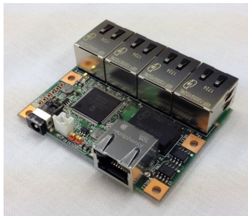
【Base Model 超小型ギガビットスイッチング HUB】